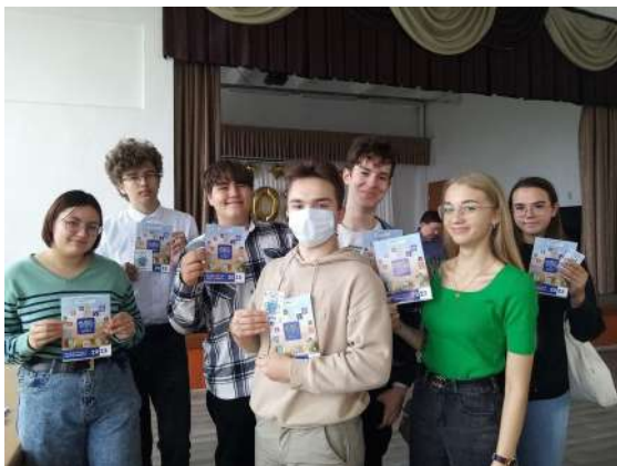
Информационный проект «Успешный абитуриент»